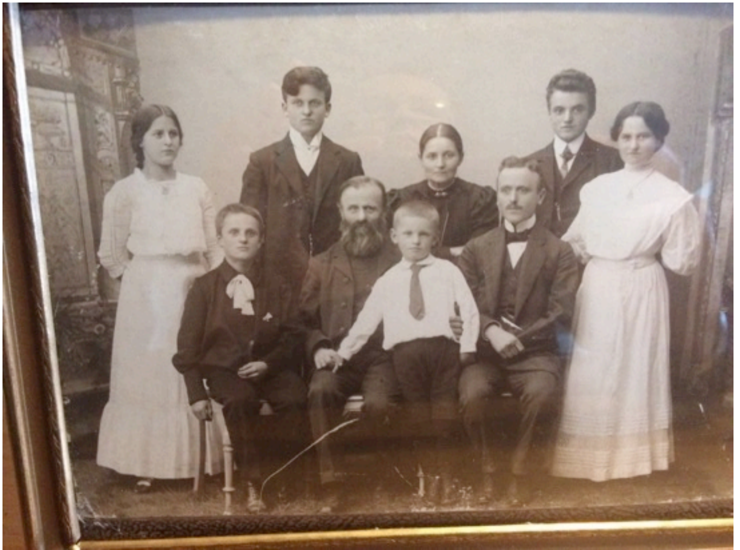
Min oldefar, farfar og familie