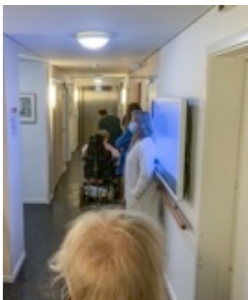
Kø til coronatesttest Dejligt at så mange lod sig teste

Besøgsrestriktionerne er ikke ophævet på Thea endnu. Vi afventer fortsat en udmelding fra Frederiksberg Kommune med dato for tilbud om vaccine. Det betyder at personalet fortsat må vurdere,